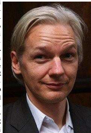
Max Nash, AP