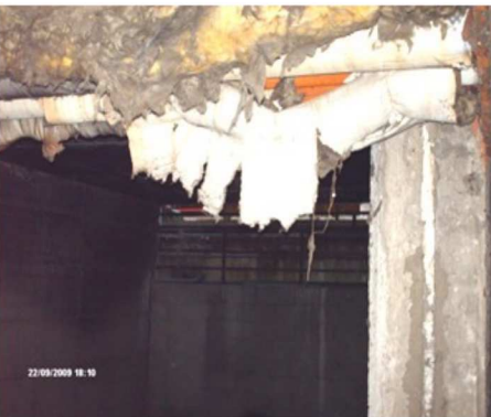
Rivestimento logoro che espone l'amianto dei rivestimenti dei tubi.

fu di 4,9 milioni di euro, speriamo non spariscono che anche questa volta. La situazione era talmente nota che l'ex sindaco Albertini scrisse agli inquilini segnalando la gravità della situazione, ma nulla avvenne. D. Quando le istituzioni cominciarono ad interessarsi alla vostra situazione? R. Dopo la trasmissione di Santoro "Anno Zero" dei primi mesi del 2008, in cui intervenne Oscar Spennati un nostro inquilino rapper, in arte White House, vi furono vari incontri anche con l'assessore alla casa Giovanni Verga e la consigliera Barbara Ciabò, che ci proposero uno stanziamento per favorire la mobilità delle famiglie in case sicure; anche il sindaco Letizia Moratti fece la sua passerella in campagna elettorale e promise che tutti gli inquilini avrebbero avuto un'altra casa e che gli abusivi sarebbero stati regolarizzati, ma l'impegno verbale non fu realizzato. Video Anno-Zero D. Avete dei dati precisi sulla dispersione dell'amianto?