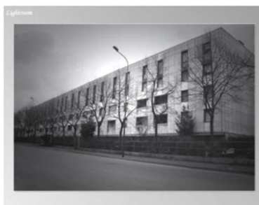
Milano la città della moda, del busi-